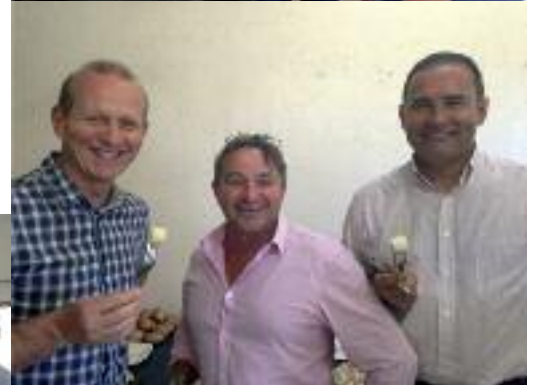
La dégustation des nouvelles variétés a remporté un grand succès ! Merci encore aux équipes du CREA pour son organisation.